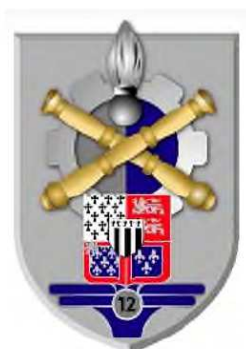
12-ème base de soutien du matériel de Gien